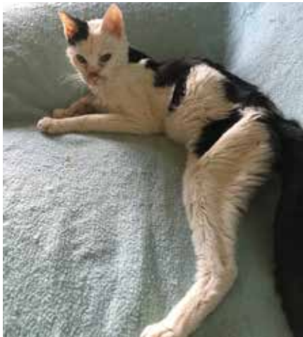
Chat trouvé qui, malgré tous nos efforts, n'a pas pu être sauvé

malgré tous nos efforts, la souffrance de l'animal ne s'estompe pas. C'est alors que nous devons prendre la difficile décision d'abrégé leur peine.